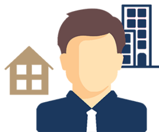
Assistant social du travail