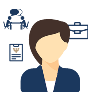
Psychologue du travail